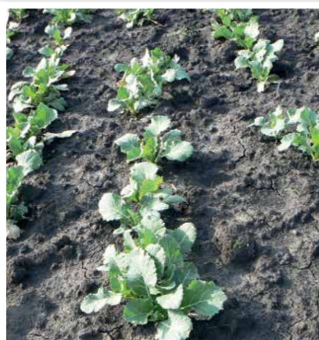
Salsa® gyomirtó szer hatása (25 g/ha)