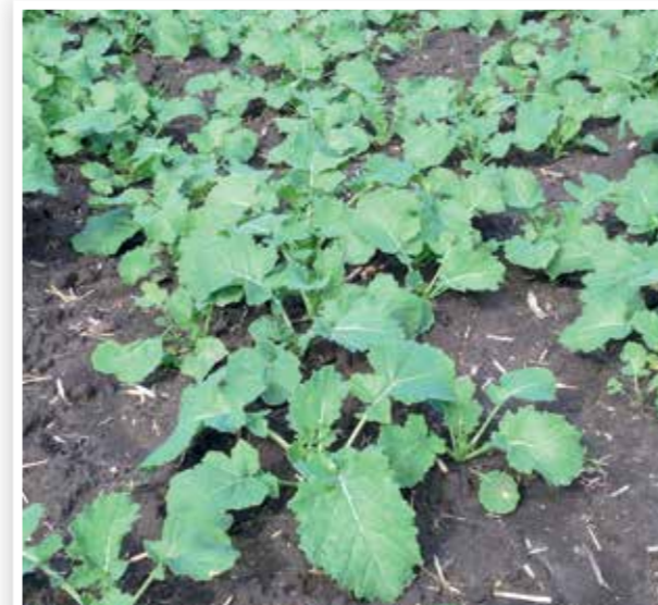
Salsa® 20 g/ha + Sultan** 2 l/ha + Trend® 0,1% 2015. október 6.