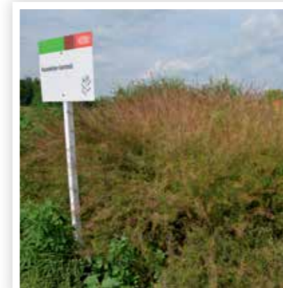
Kezeletlen, 2016. június 14.