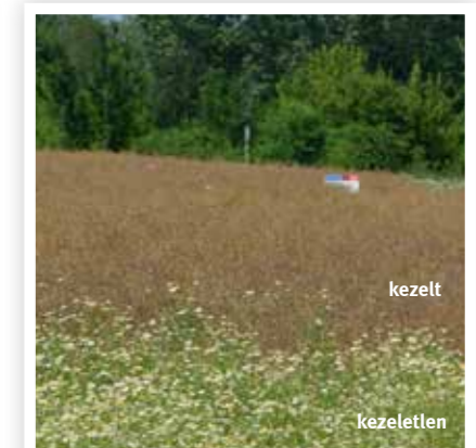
Salsa® 20 g + Ikarus* 0,3 l/ha + Trend® 0,1% 2016. június 22.