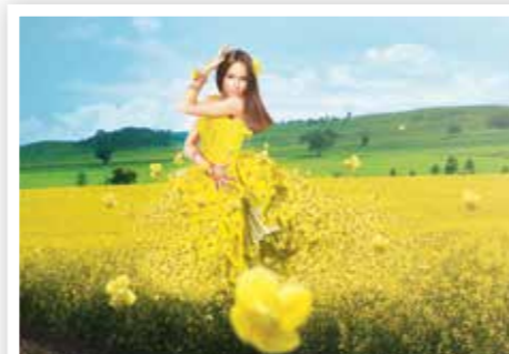
Ideális fordulat a repcegyomirtásban

© az E. I. du Pont de Nemours and Company bejegyzett márkanéve