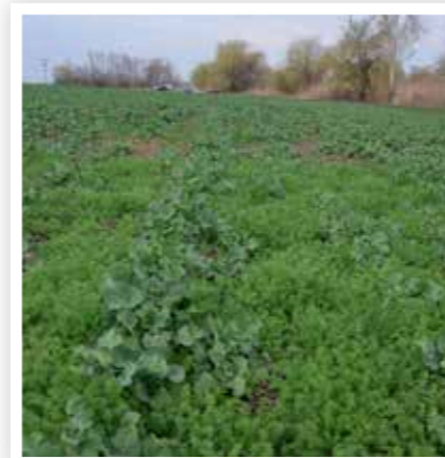
Kezeletlen, 2016. március 11.