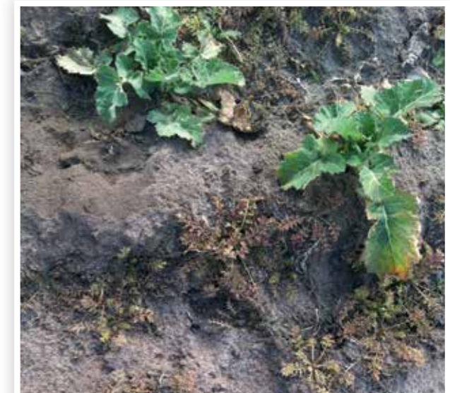
Salsa® 20 g/ha + Ikarus* 0,3 l/ha + Trend® 0,1% 2015. március 11.