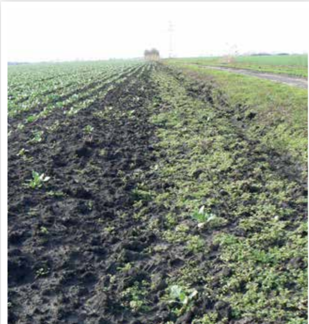
Kezelési hiba, 2016. március 2.